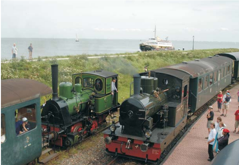
Bij de foto: Volop activiteiten in Medemblik