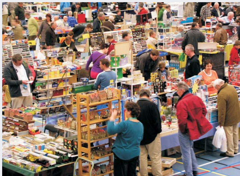
Alle beurzen duren van 10.00 - 15.00 uur.

Amstelveen-Zuid Amstelveen College, Startbaan 12 Afrit A9 "Amstelveen" zaterdag 6 december