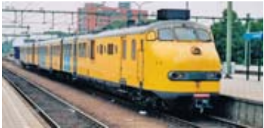
Dieseltreinstellen plan U