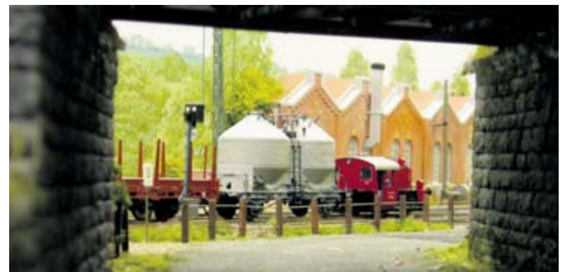
Deelnemers Eurospoor2009. Foto's links en linksonder: "Durlsbach"; sublieme romantische modelbaan uit de tijd van de stoomlocomotief gepresenteerd door Freunde der Eisenbahn Burscheid e.V. Foto boven: Doorblikje op de prachtige Emsland-Veenbaan van modelspoorwegclub Spijkspoor (zie ook pagina 6).